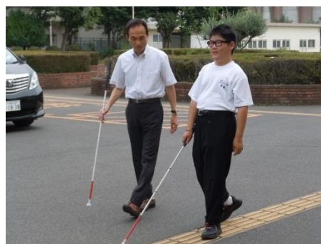
《自立活動・歩行指導》