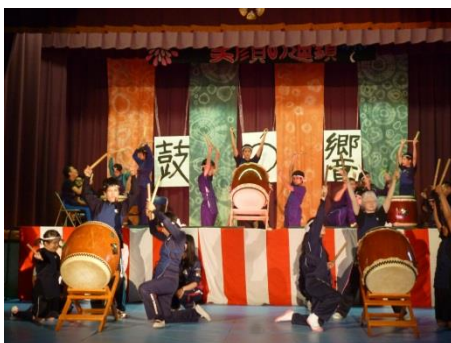
《霜月祭・ステージ発表》